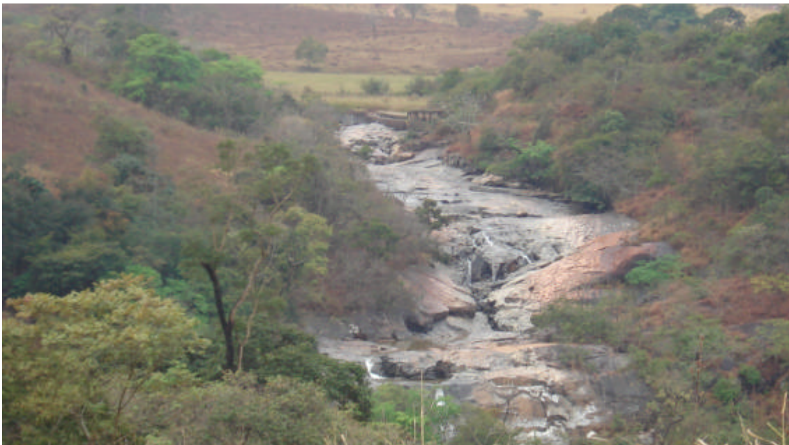
Figura 2: Trecho de Vazão Reduzida da atual PCH Caquende. Foto tirada do local da atual casa de força.