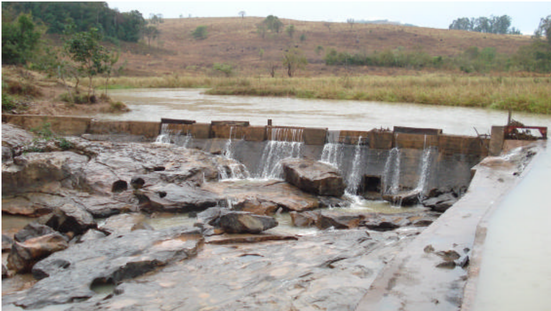
Figura 1: Barramento e Reservatório da PCH Caquende. Nesta foto é possível observar o Dispositivo para Manutenção da Vazão Residual e os Vertedouros: Lateral e sobre o curso do rio.